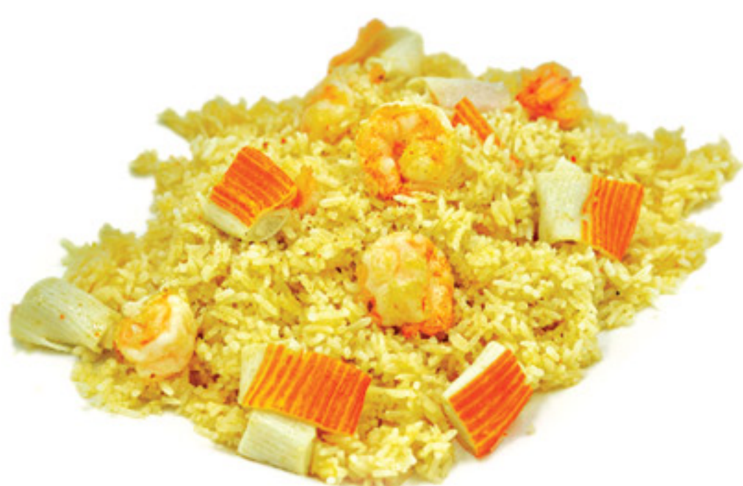
N4 Riso con surimi di granchio e mazzancolle.*