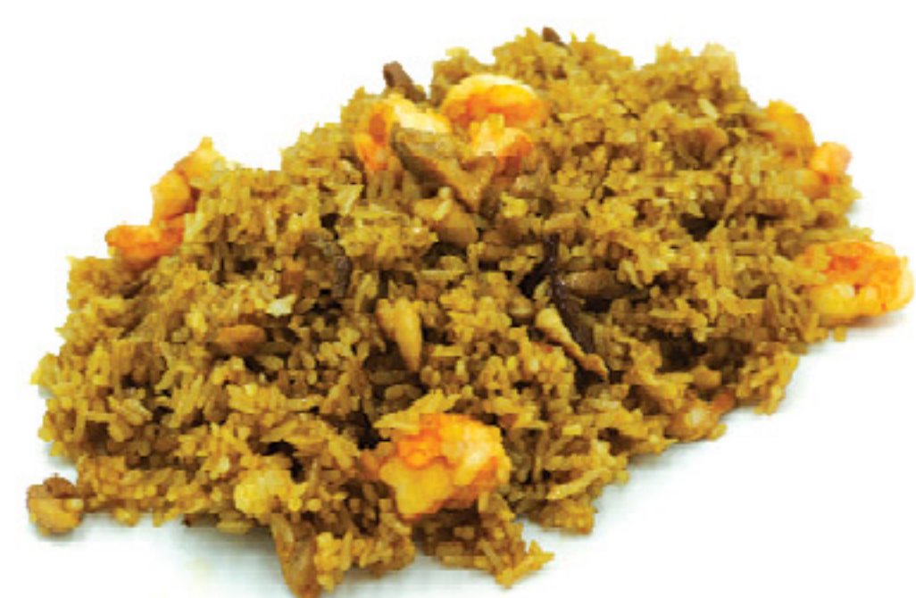
N6 Riso speciale con pollo, vitello e mazzancolle.*