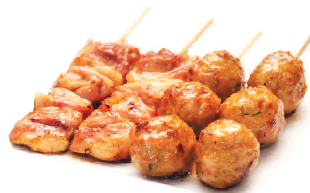
A1 4 spiedini: 2 cosce di pollo 2 polpette di pollo

Servito con 1 zuppa + 1 insalata + 1 riso