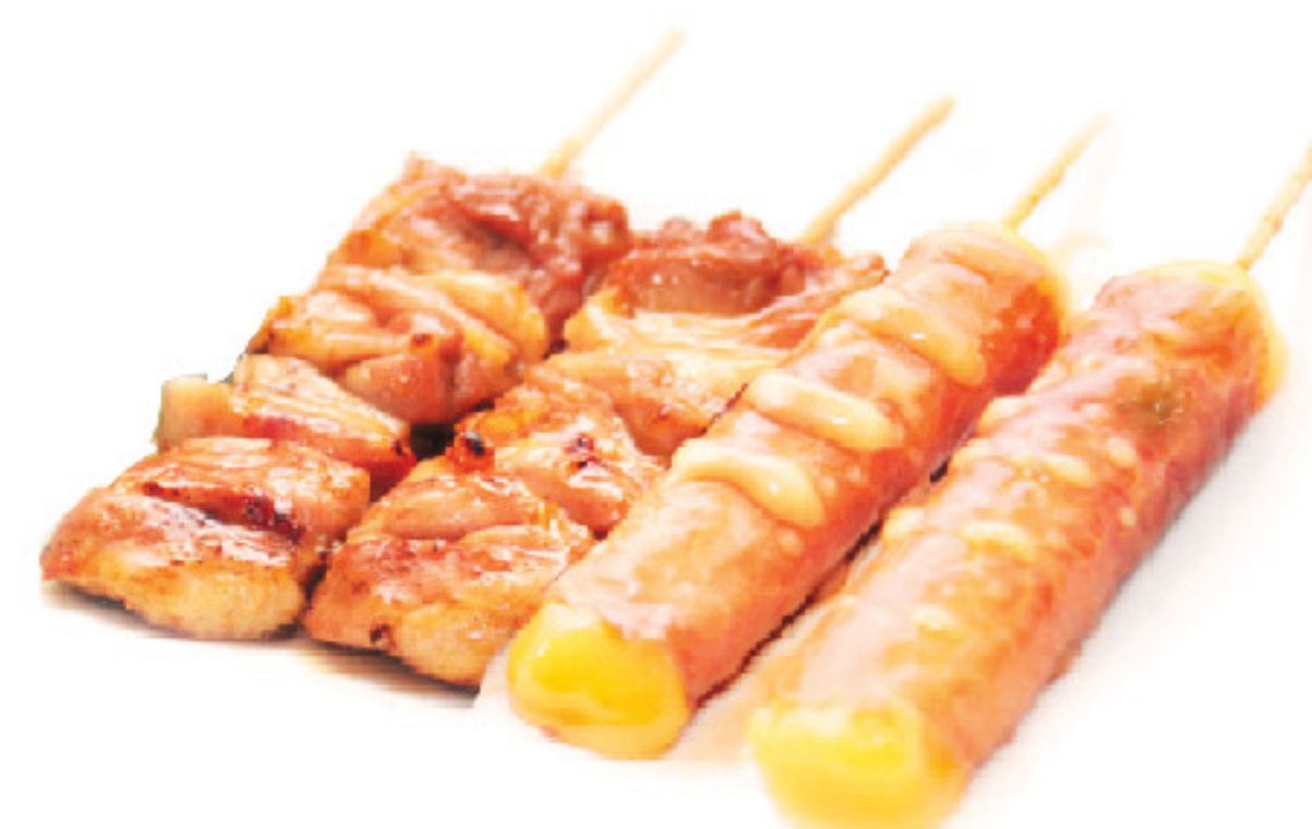
A3 4 spiedini: 2 cosce di pollo 2 formaggio