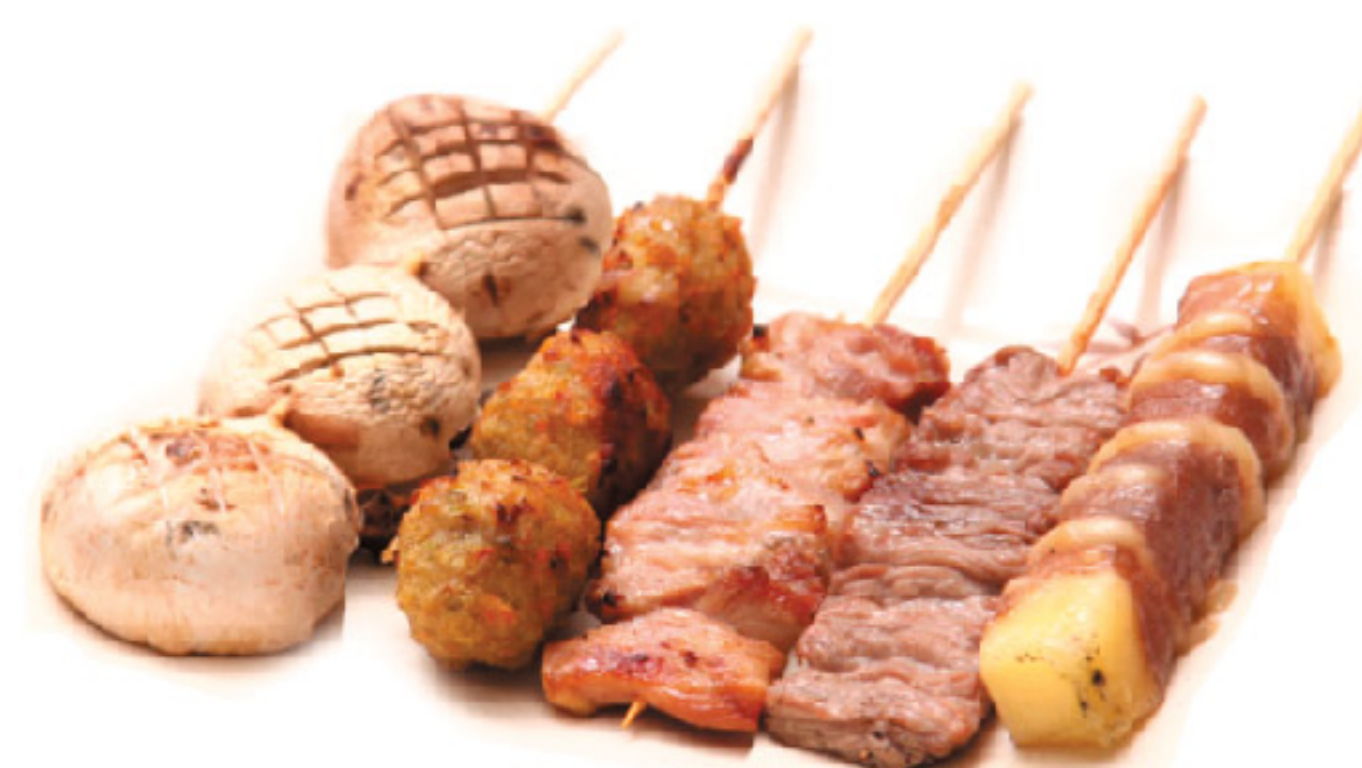
C2 5 spiedini: 1 cosce di pollo, 1 polpette di pollo, 1 vitello, 1 formaggio, 1 champignon