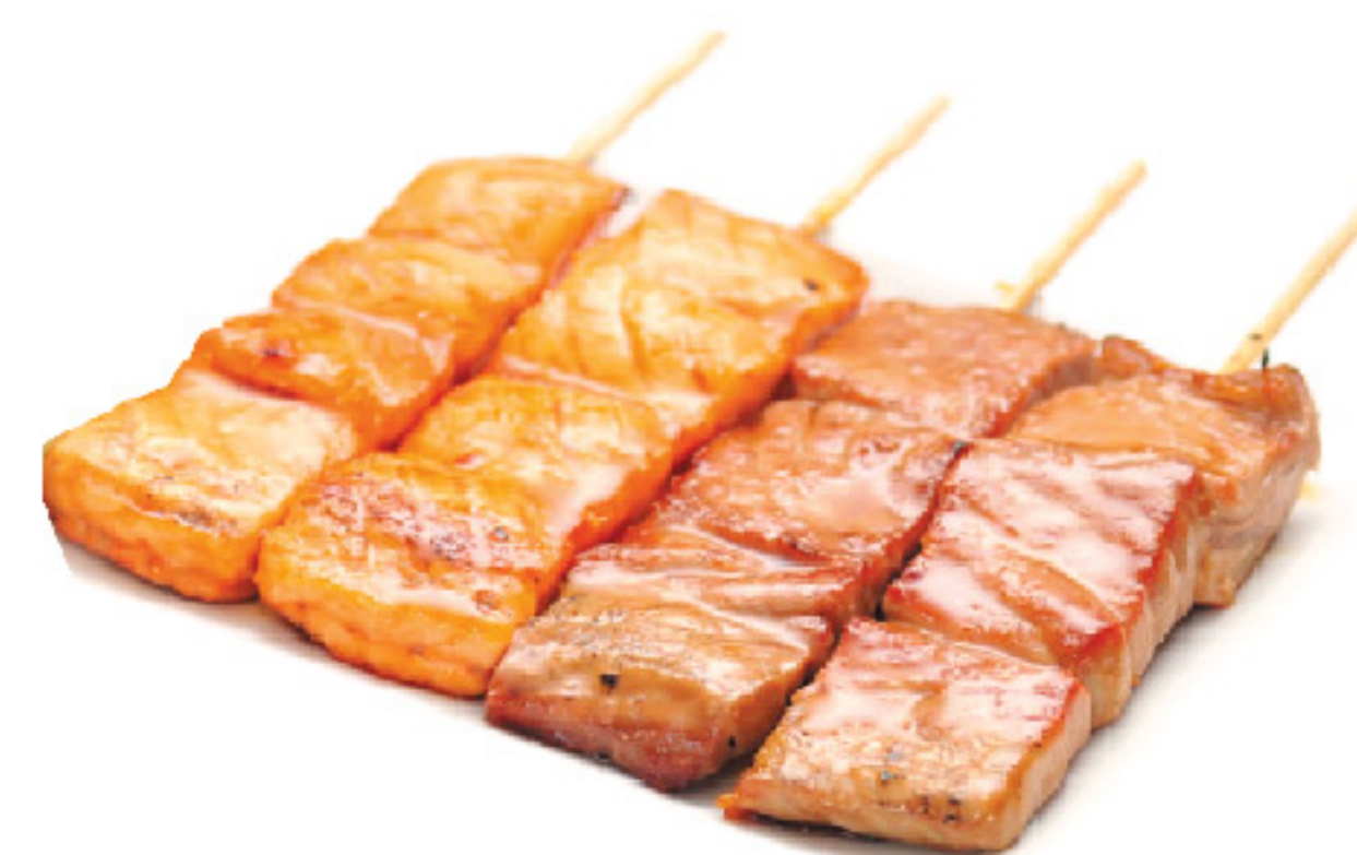
B1 4 spiedini: 2 tonno grigliato 2 salmone grigliato Lo vuoi tutto al salmone?