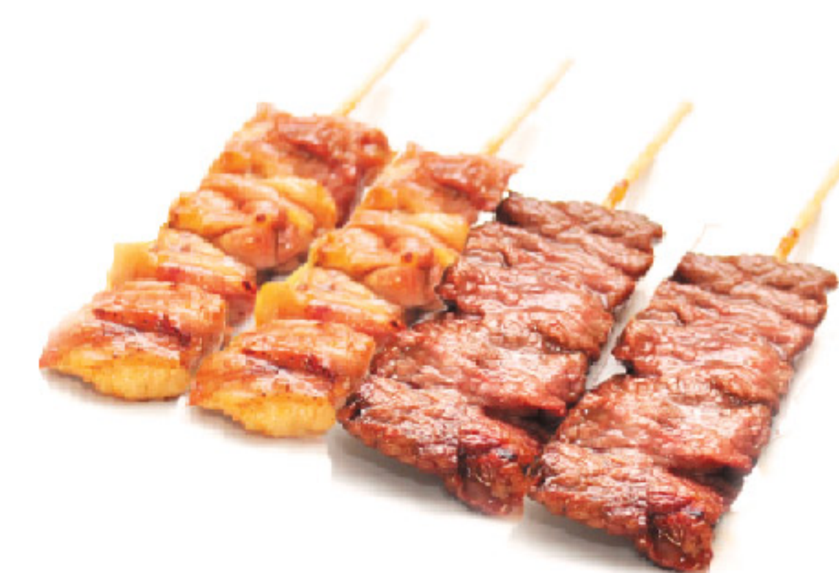
A2 4 spiedini: 2 cosce di pollo 2 vitello