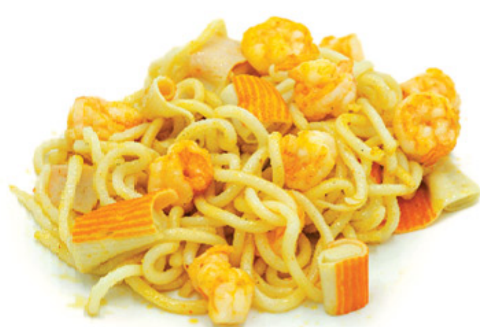
N5 Spaghetti con surimi di granchio e mazzancolle.*