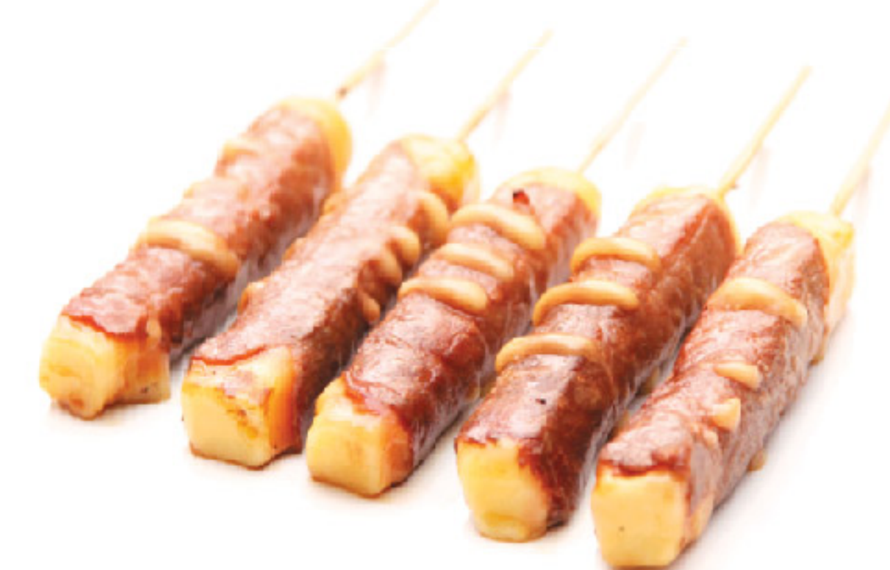
C1 5 spiedini: 5 formaggio