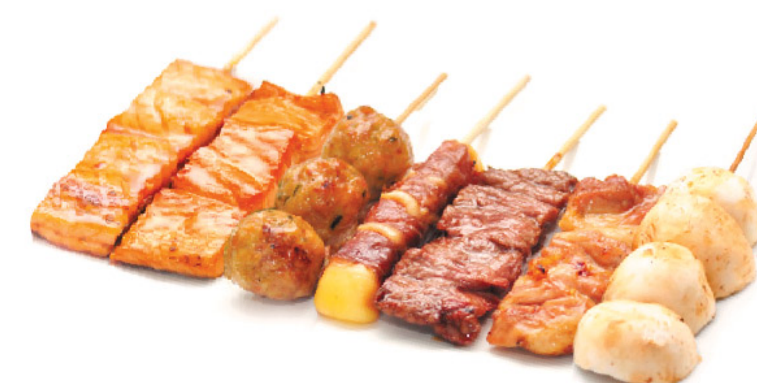
E 7 spiedini: 2 salmone grigliato, 1 vitello, 1 polpette di pollo, 1 formaggio, 1 cosce di pollo, 1 champignon