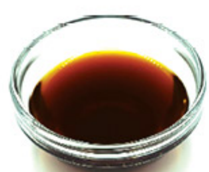
Aromatica (soia all'aceto)